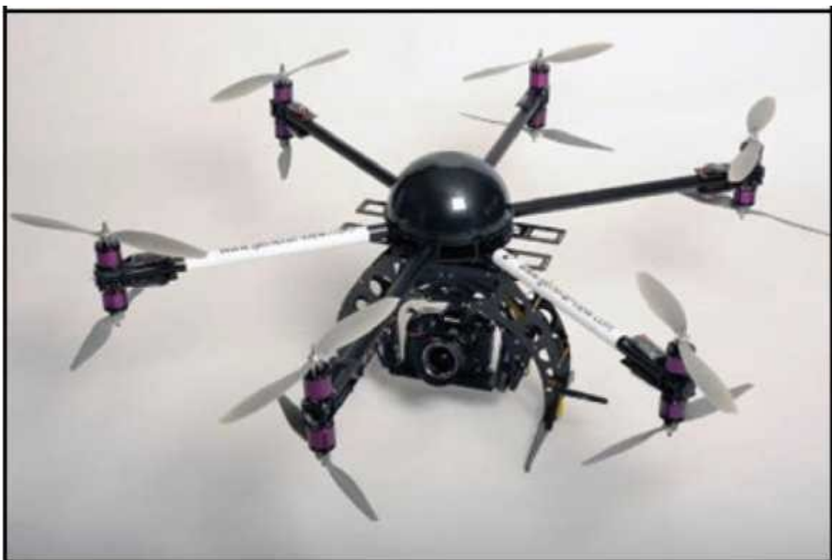
Рис. № 5 – многооторный БПЛА.

Тип БПЛА, который с каждым днем получают все большее распространение, – многооторные системы. Их еще называют мультикоптерами, квадрокоптерами, гексакоптерами, октакоптерами и тому подобное, в зависимости от количества несущих винтов. Характерная особенность – многооторная система, принцип полета – подобен вертолетному (рис. № 5).