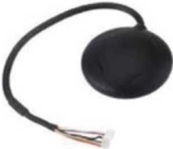
Рис. № 8 – Модуль GPS-навигации.

По сути, модуль GPS навигации (рис. № 8) является приемником GPS-сигнала с калькулятором, устанавливается подальше от оборудования, создающего электромагнитные наводки. Модуль необходим для ориентирования в пространстве, для определения расположения БПЛА. В мире существует несколько систем спутниковой навигации, а именно: американская – GPS, европейская – Galileo, российская – ГЛОНАСС, китайская – Бейдоу. Разницы для пользователя практически никакой.