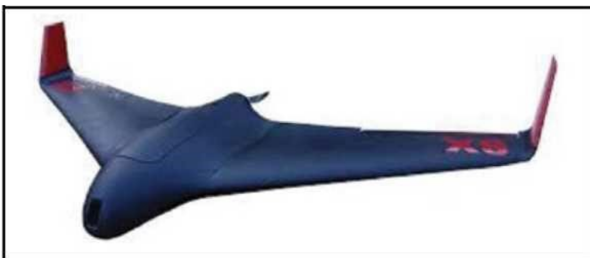
Рис. № 7 – БПЛА тип «летающее крыло».