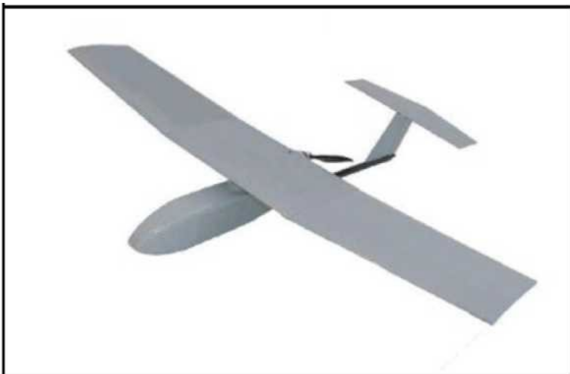
Рис. № 6 – БПЛА самолетного типа.