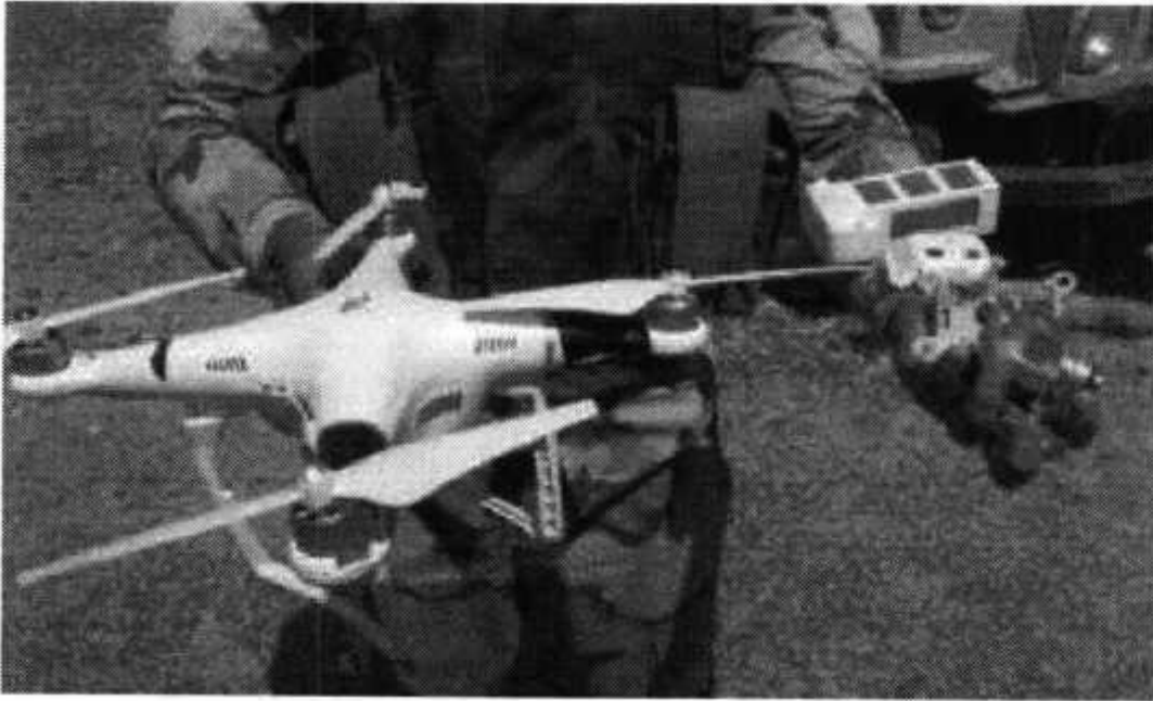
Рис. № 1 – БВС вертолетного типа.

Для совершения диверсионных актов могут использоваться БВС самолетного и вертолетного типа (рис. № 1) кустарного производства, причем доля последних значительно превышает количество самолетных. Объясняется это в первую очередь их более низкой стоимостью.