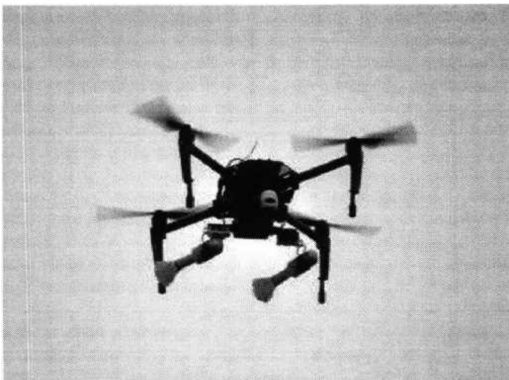
Рис. № 3 – квадрокоптер.

гранат боевики используют отрезок пластиковой трубы, в которой с помощью лески закрепляется граната.