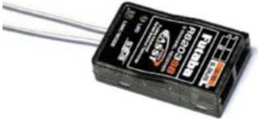
Рис. № 11 – Приемник аппаратуры управления.

Приемник аппаратуры управления (рис. № 11) предназначен для связи БПЛА с пультом управления, как правило, этот канал имеет небольшую дальность – до 2 км и используется только для выполнения взлета и посадки. Существуют БПЛА с таким каналом дальнего действия (аппаратура Dragon Link).