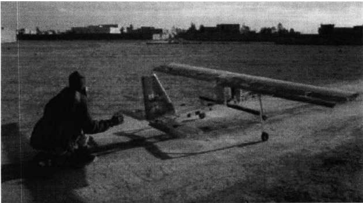
Рис. № 4 – малогабаритный летательный аппарат.

Поэтому БВС-камикадзе специалисты называют «барражирующим боеприпасом». При весе в 10 – 20 кг беспилотник-самоубийца способен выполнять задачи на расстоянии 20 – 30 км от точки запуска.