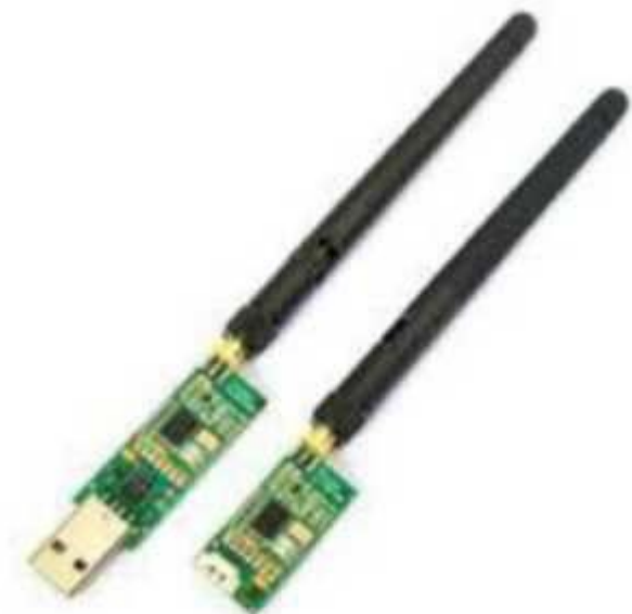
Рис. № 9 – Модем телеметрии.