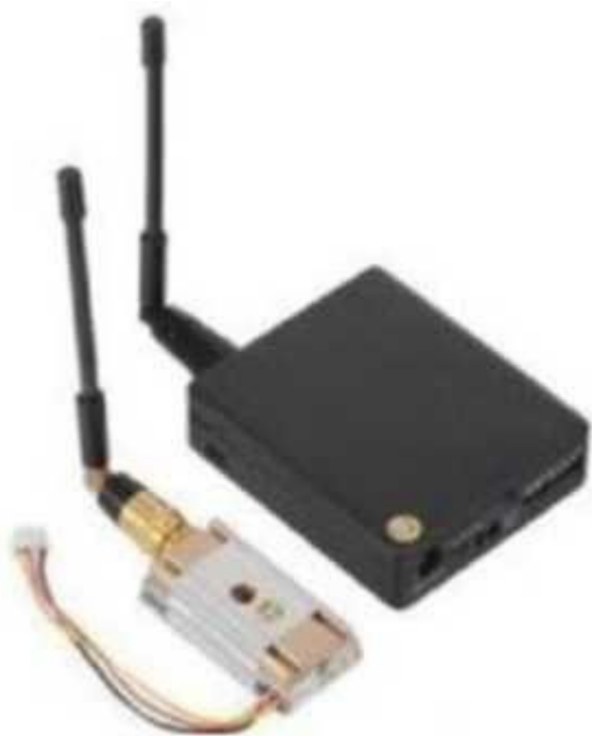
Рис. № 10 – Видеопередатчик.

Видеопередатчик (рис. № 10) – это устройство, передающее на наземную станцию изображение с камер БПЛА. Является самым заметным устройством на борту БПЛА, поэтому без необходимости включать его не стоит (это касается только тех БПЛА, которые хранят фотографии на борту), соблюдая режим радиомолчания. Такой режим уменьшает возможность применения противником средств РЭБ.