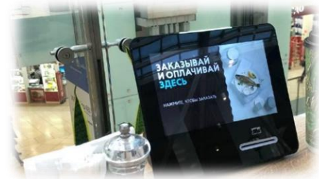
ПЛАТЕЖНЫЙ ТЕРМИНАЛ «КАТЕ TABLET»