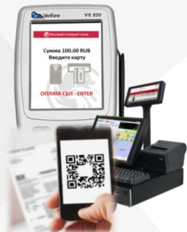
КАССОВЫЕ СИСТЕМЫ И POS-ТЕРМИНАЛЫ