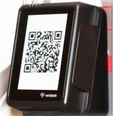
ТЕРМИНАЛЫ VENDOTEK И ПОСТАМАТЫ CDEK