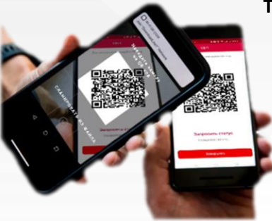
ОПЛАТА В ПРИЛОЖЕНИИ РСБ SOFTPOS