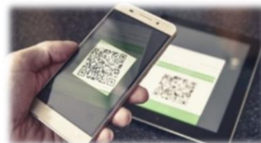
ИНТЕРНЕТ-САЙТЫ И МОБИЛЬНЫЕ ПРИЛОЖЕНИЯ ПАРТНЕРОВ