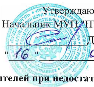
График ограничения и аварийного отключения потребителей при недостатке тепловой мощности или топлива по системе теплоснабжения на осенне-зимний период.